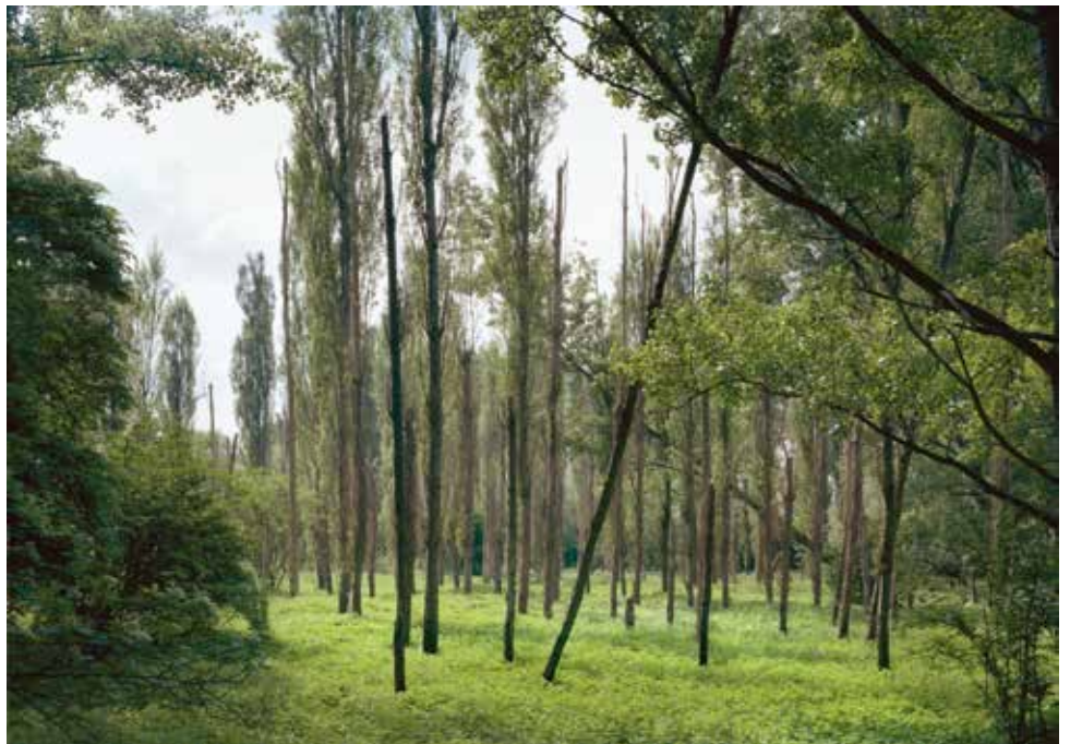
Sébastien Reuzé Constellations , 2002 Photo 90 x 120 cm, Collection Contretype