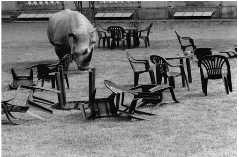
Première page / Alain Païement Un Etat des lieux, 1997, martyrs Photo 110 x 180 cm Collection Contretype