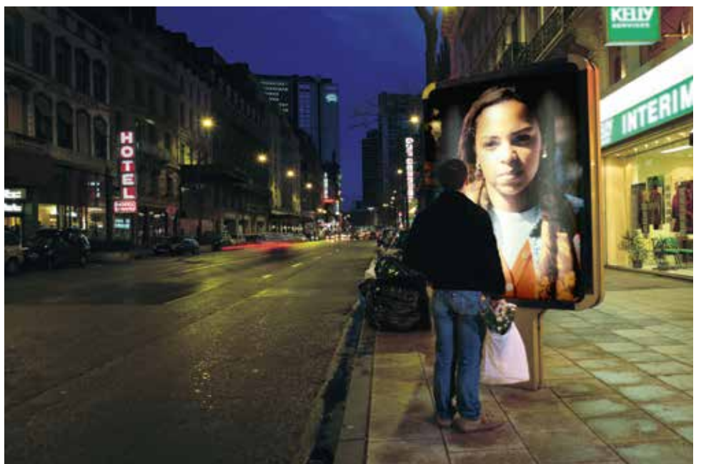
→ Angel Marcos La chute 33 , 2000 caisson lumineux 51,93 x 70 cm, Collection Contretype © Angel Marcos