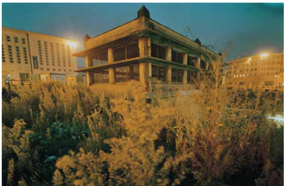
JH Engström Je suis où (La résidence) , 2003 Photo 90 x 120 cm Collection Contretype © JH Engström