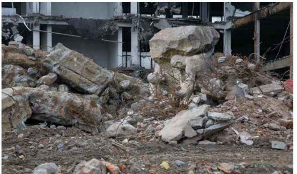
Isabelle Hayeur Photo Formes de monuments, Monuments aux hommes des carrières III , 2009 Photo 52 x 78 cm, Collection Contretype