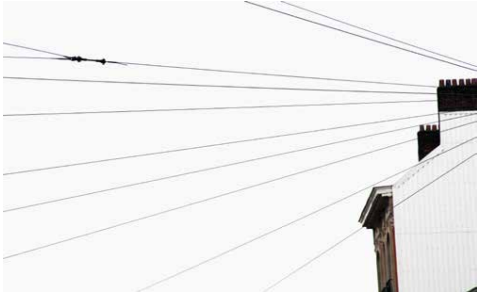
Enikő Hangay Dessin de la ville, cordes de voile , 2012 Photo 40 x 60 cm, Collection Contretype © Enikő Hangay