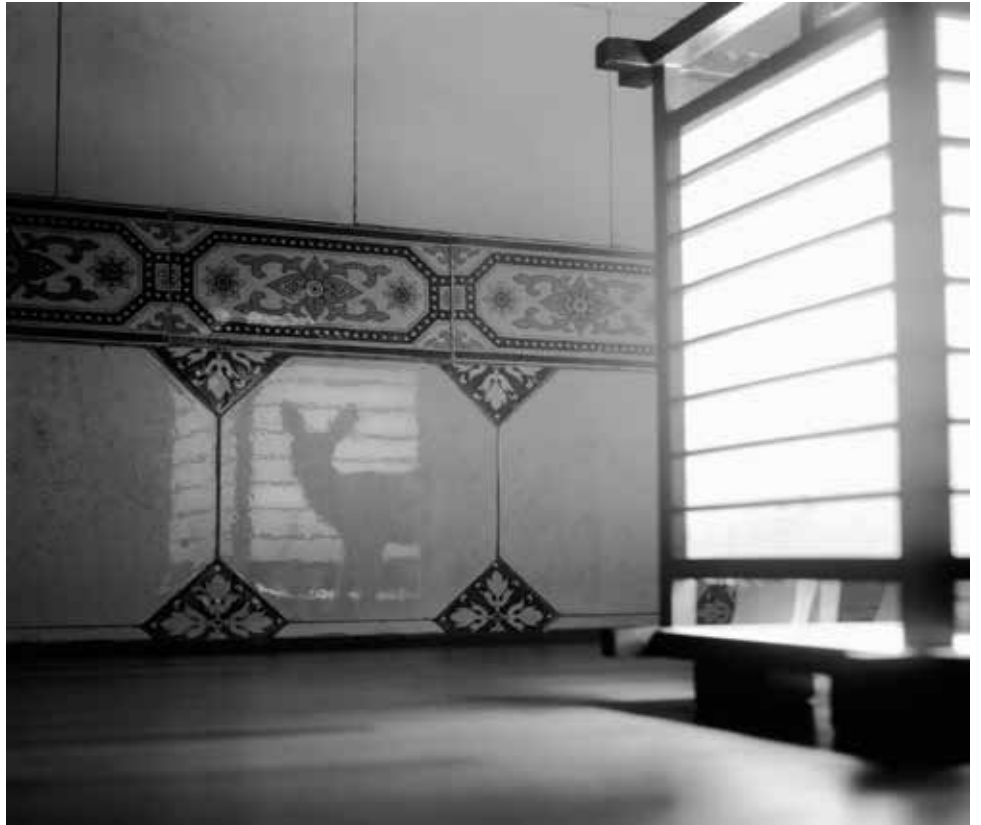
Vicente De Mello Silent city, Théâtre d'ombre , 2012 Photo 120 x 120 cm Collection Contretype