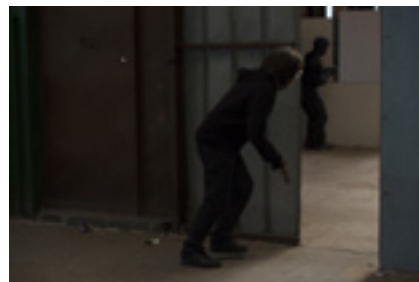
Visuel 4 : Play Again, résidence de création, Givors