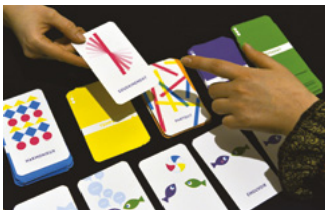
Les Mots du Clic © Alain Kaiser, 2016

Quel regard porter sur une image ? Comment en parler ? Comment analyser sa construction et sa destination ? Le jeu Les Mots du Clic a été créé pour questionner le regardeur. Il est à la fois un jeu d'observation, d'expression et de réflexion.