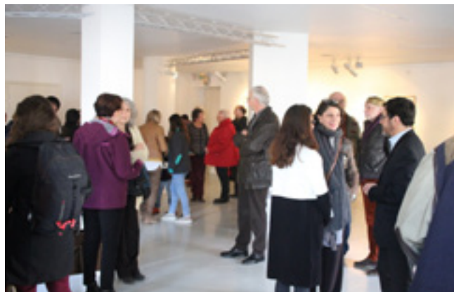
Vernissage de l'exposition de Pentti Sammallahti à Givors © Stimutania, mars 2017

Visite commentée en présence de l'artiste.