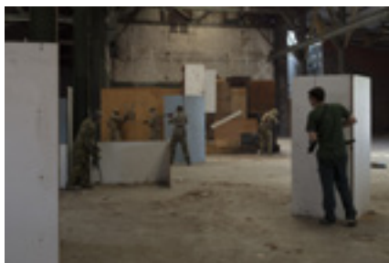
Visuel 1 : Play Again, résidence de création, Givors

Camille Bonnet +33 (0)3 88 23 63 11 camille.bonnet@stimultania.org