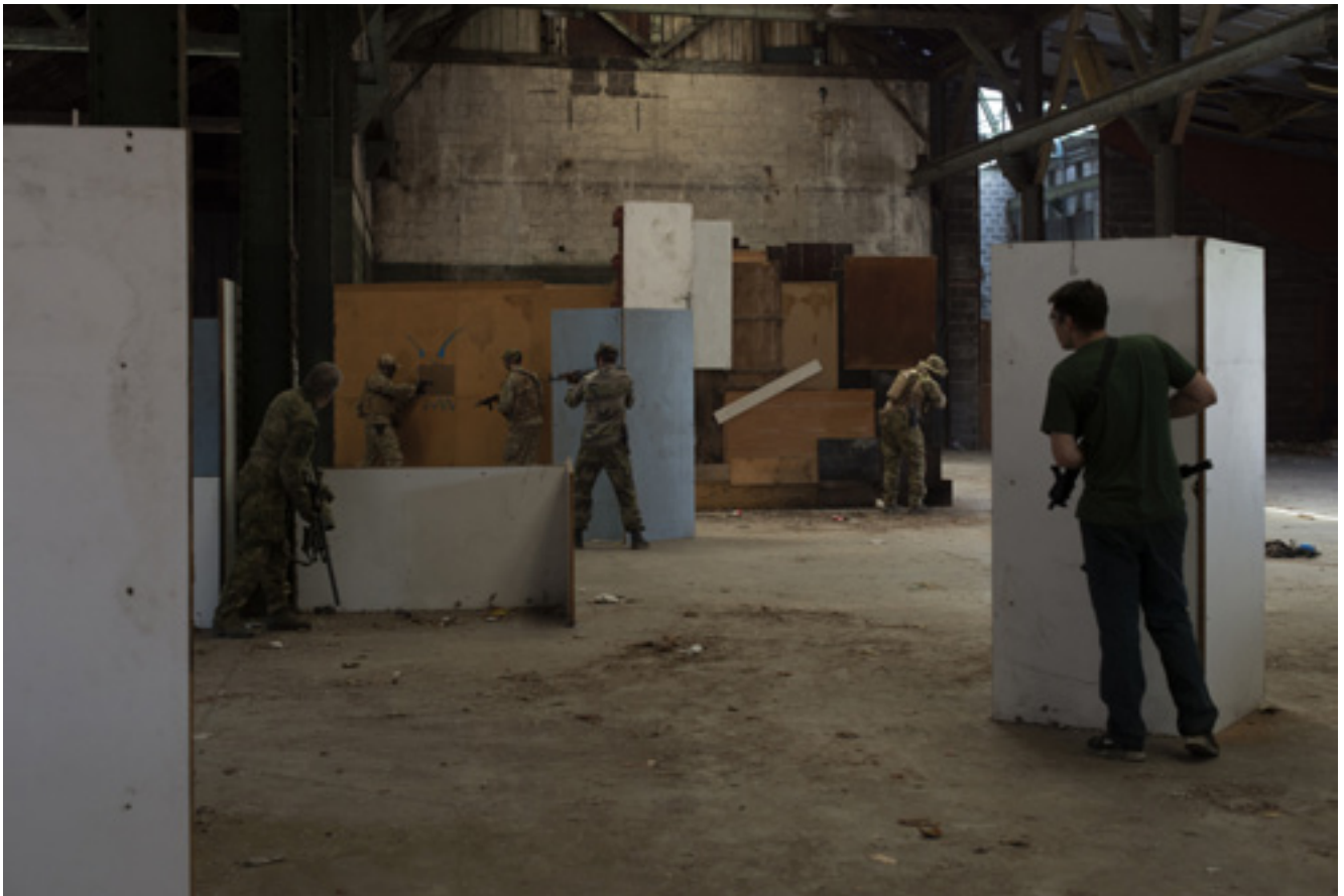
Play Again, résidence de création, Givors