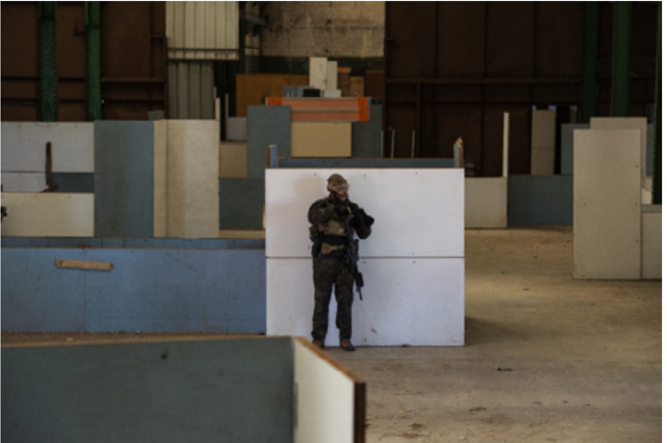
Play Again, résidence de création, Givors