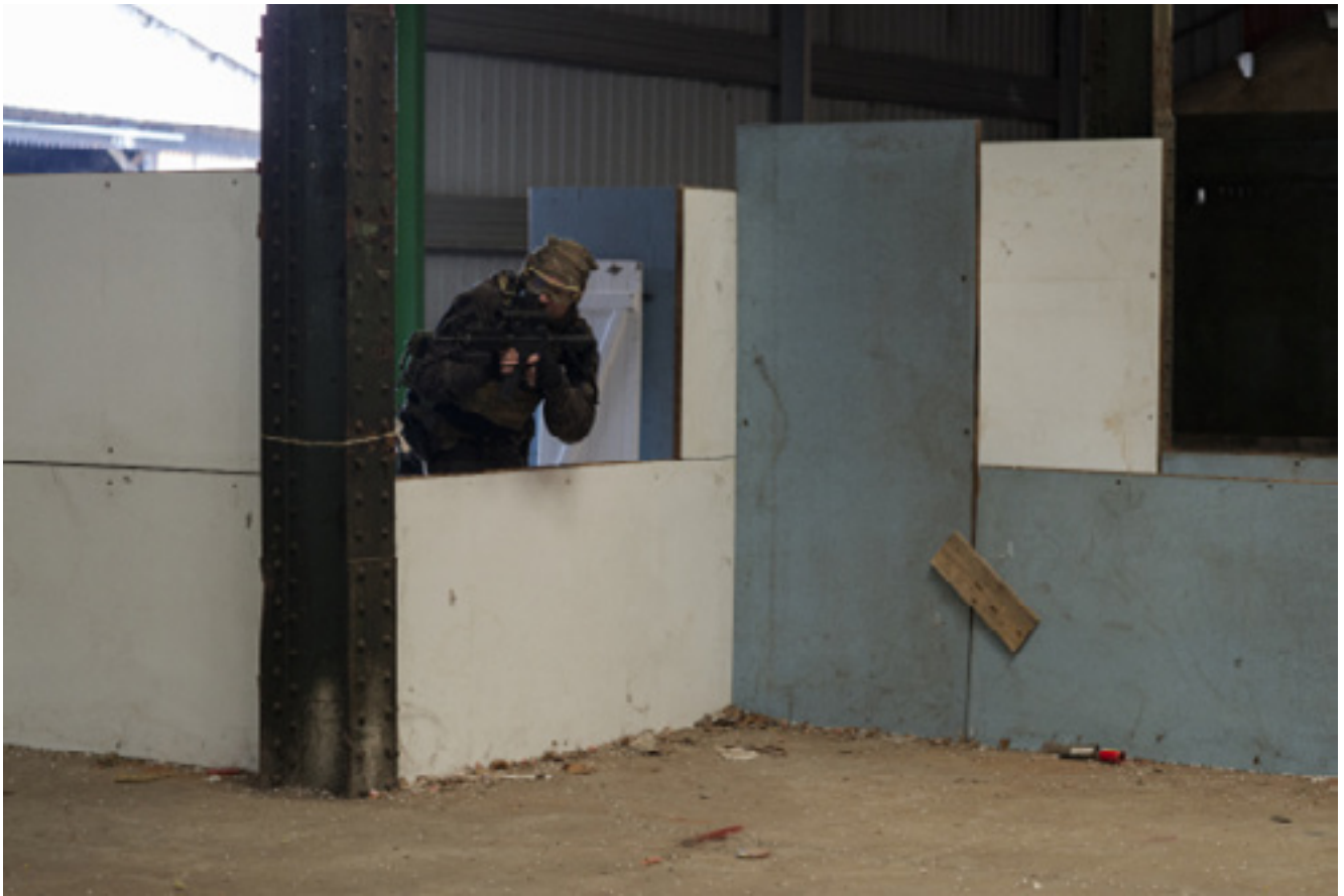
Play Again, résidence de création, Givors