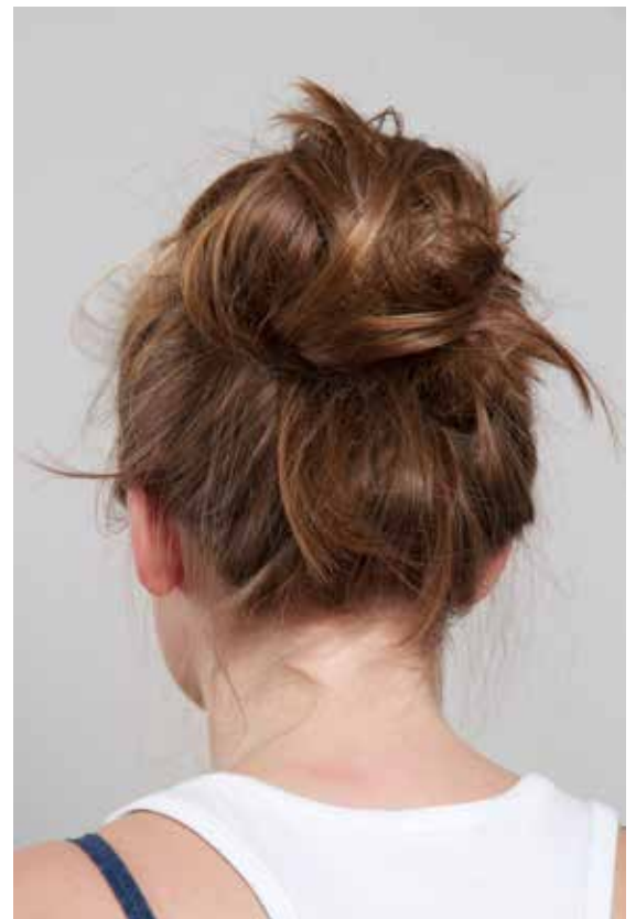
↗ Marie José Burki, H1 , de la série AOS , 2012 © Marie José Burki